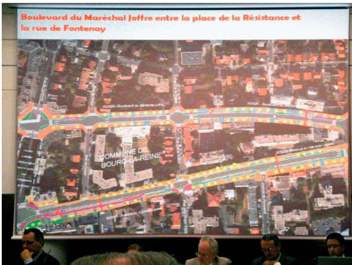
Présentation du Bd Maréchal Joffre entre la place de la Résistance et la rue de Fontenay.